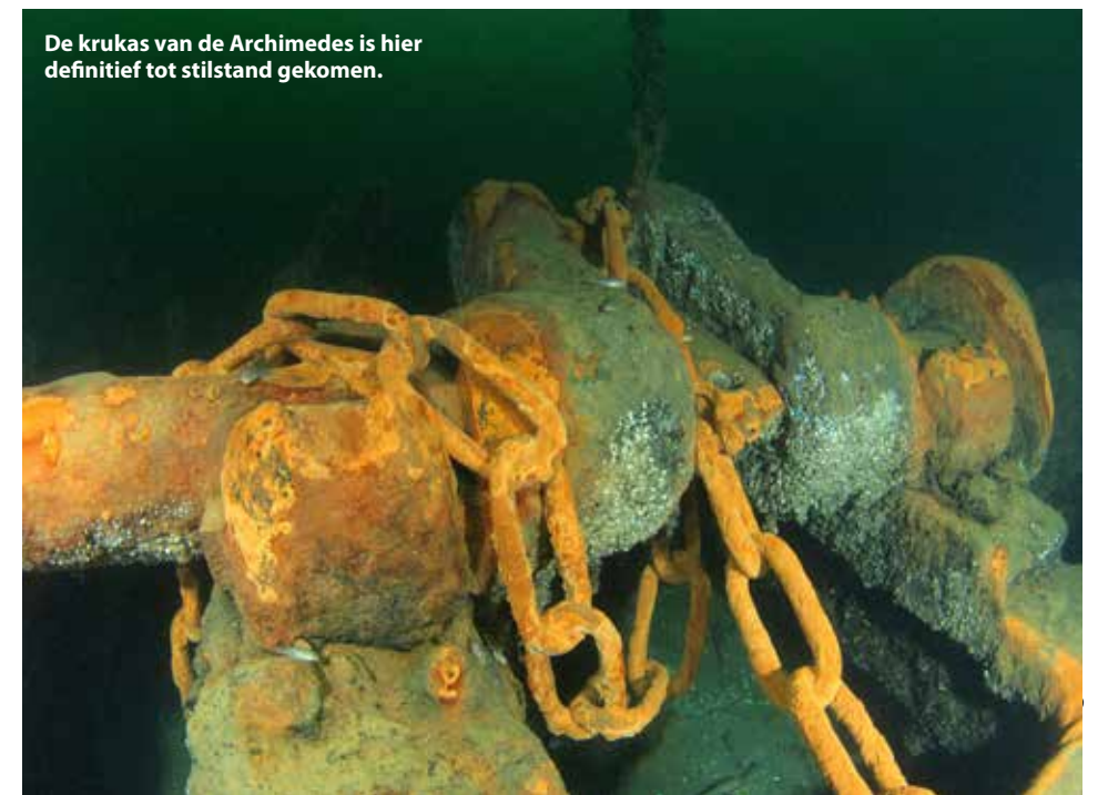
De krukas van de Archimedes is hier definitief tot stilstand gekomen.

wrakstukken verspreid over de bodem liggen. Temeer omdat op deze locatie de beruchte zandbank Maasdroogen te vinden was. We stuiten daarom al snel op de wrakstukken van de Archimedes, een stoomzeilschip uit 1839 dat vermoedelijk ook slachtoffer is geworden van de zandbank. Aan de krukas zit een ketting vast die is verbonden met een gele oppervlakteboei. Schuin doorzwemmend naar een diepte van 8 meter ontdekken we nog veel meer wrakstukken en we komen uit bij een steenstort van grote breukstenen. Regelmatig kijk ik even naar de oppervlakte want af en toe kun je een school haringen zien. We zwemmen richting Loswal en ontdekken veel platvis op de bodem, het is Platichthys flesus oftewel bot.