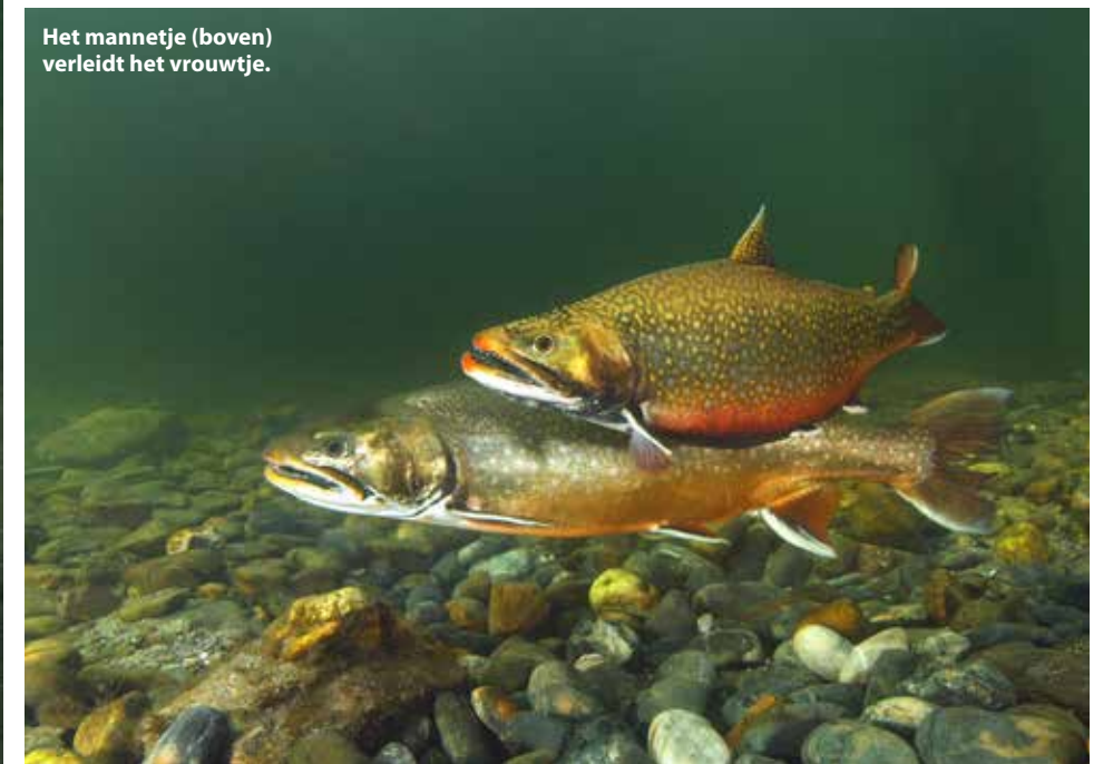
Het mannetje (boven) verleidt het vrouwtje.