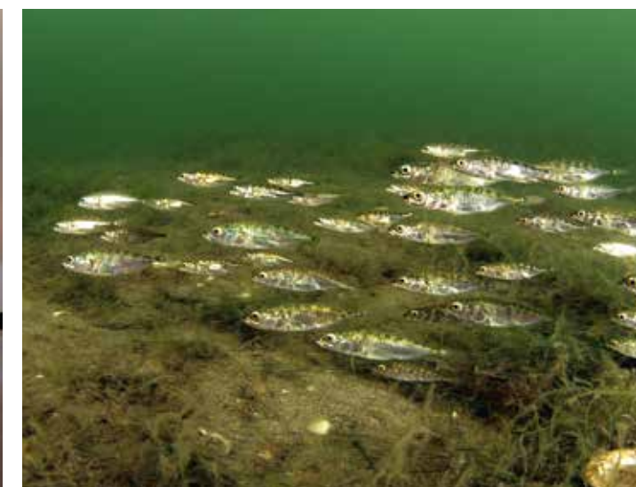
Met de klok mee: Wanneer het zoutgehalte hoog is, doen de krabben het goed. In formatie: de Elzasser saibling. Een regenboog, zou dat een voorteken zijn voor regenboogforellen? Met name in het voorjaar kom je de driedoornige stekelbaars tegen.