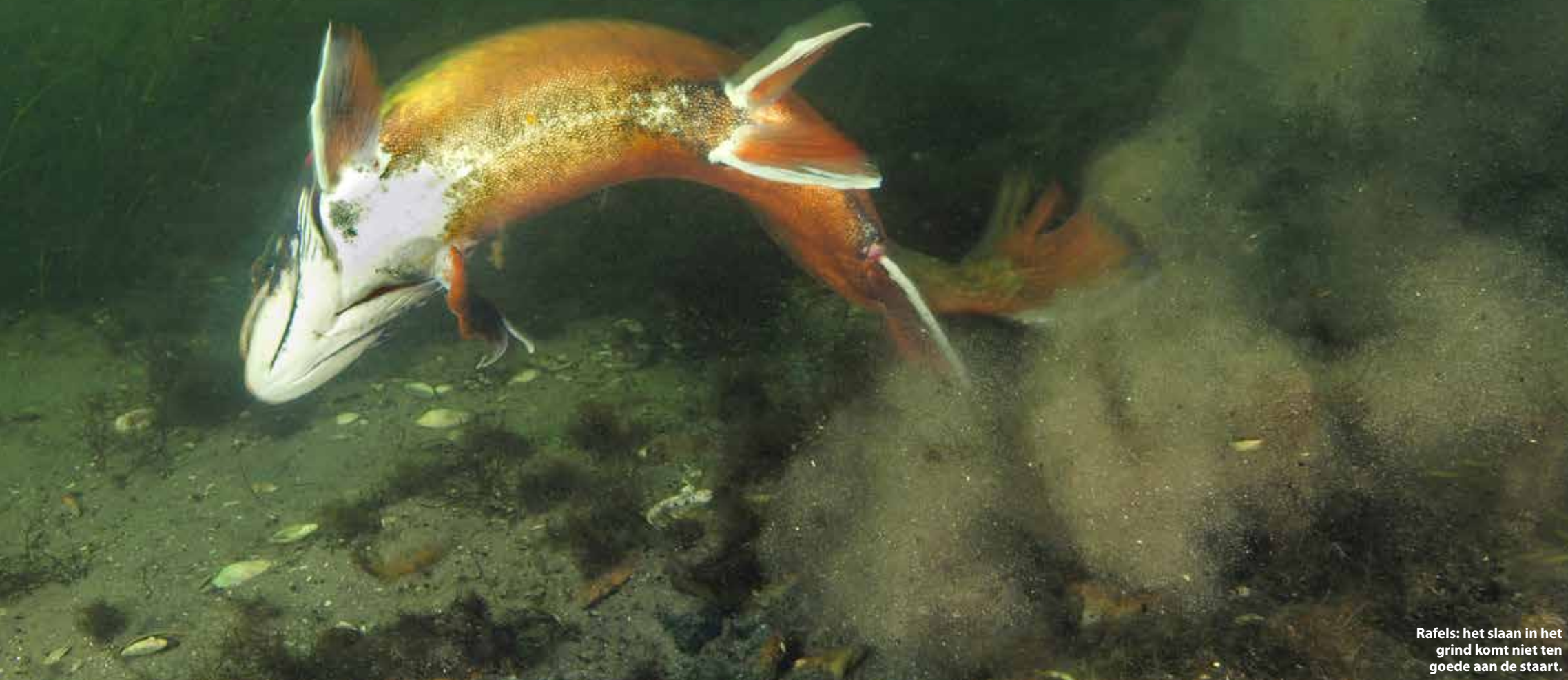
Rafels: het slaan in het grind komt niet ten goede aan de staart.