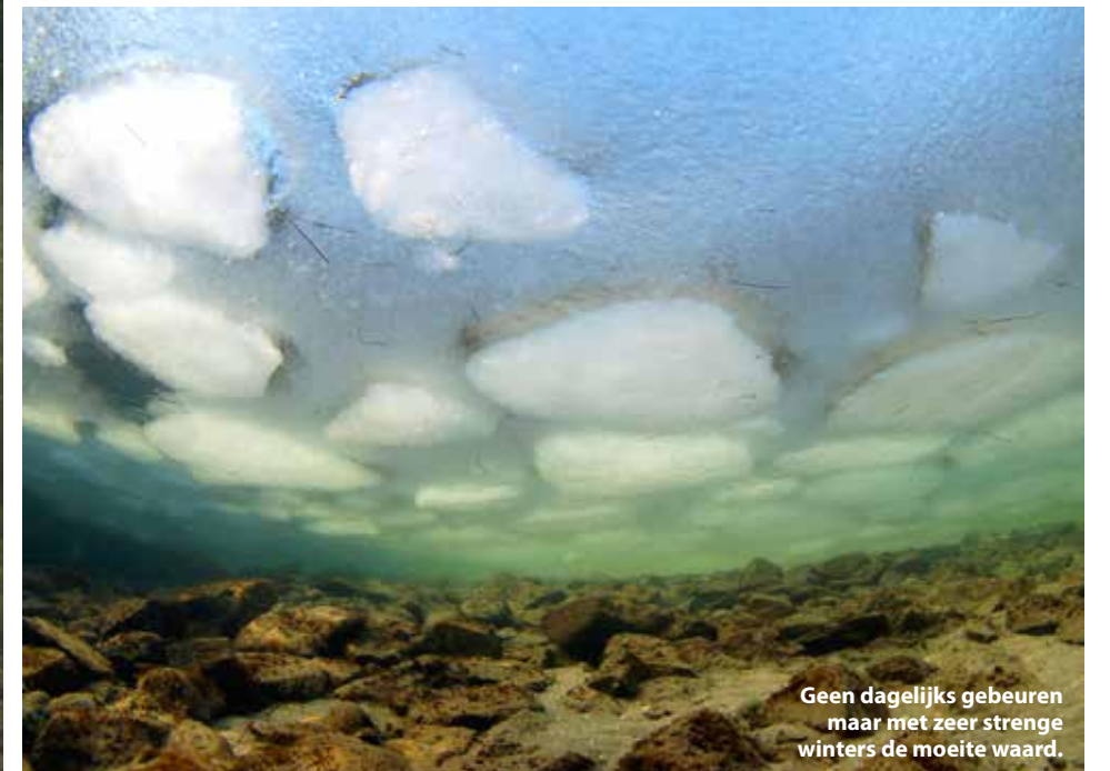
Geen dagelijks gebeuren maar met zeer strenge winters de moeite waard.

B oven een klein grindbedje blijf ik stilhangen. Het zijn eitjes van een vis, en ik weet precies welke: de Elzasser saibling. Ik heb me flink verdiept in het paaigedrag van deze dieren dus ik weet ook hoe hun eitjes eruit zien. De Elzasser saibling is een kruising tussen de Amerikaanse bronforel en de Arctische forel (beekridder). De bek van de mannetjes vervormen in de paaperiode tot haakbekken en de kleuren worden feller. De vrouwtjes slaan met hun staart een kuiltje in de grindbodem, waarbij de staart veel te lijden heeft en voor een groot deel gaat rafelen. Ik bekijk de eitjes nog eens goed. Ze zitten vol met rimpels en deukjes. Het lijken wel verschrompelde ballonnen die nagenoeg