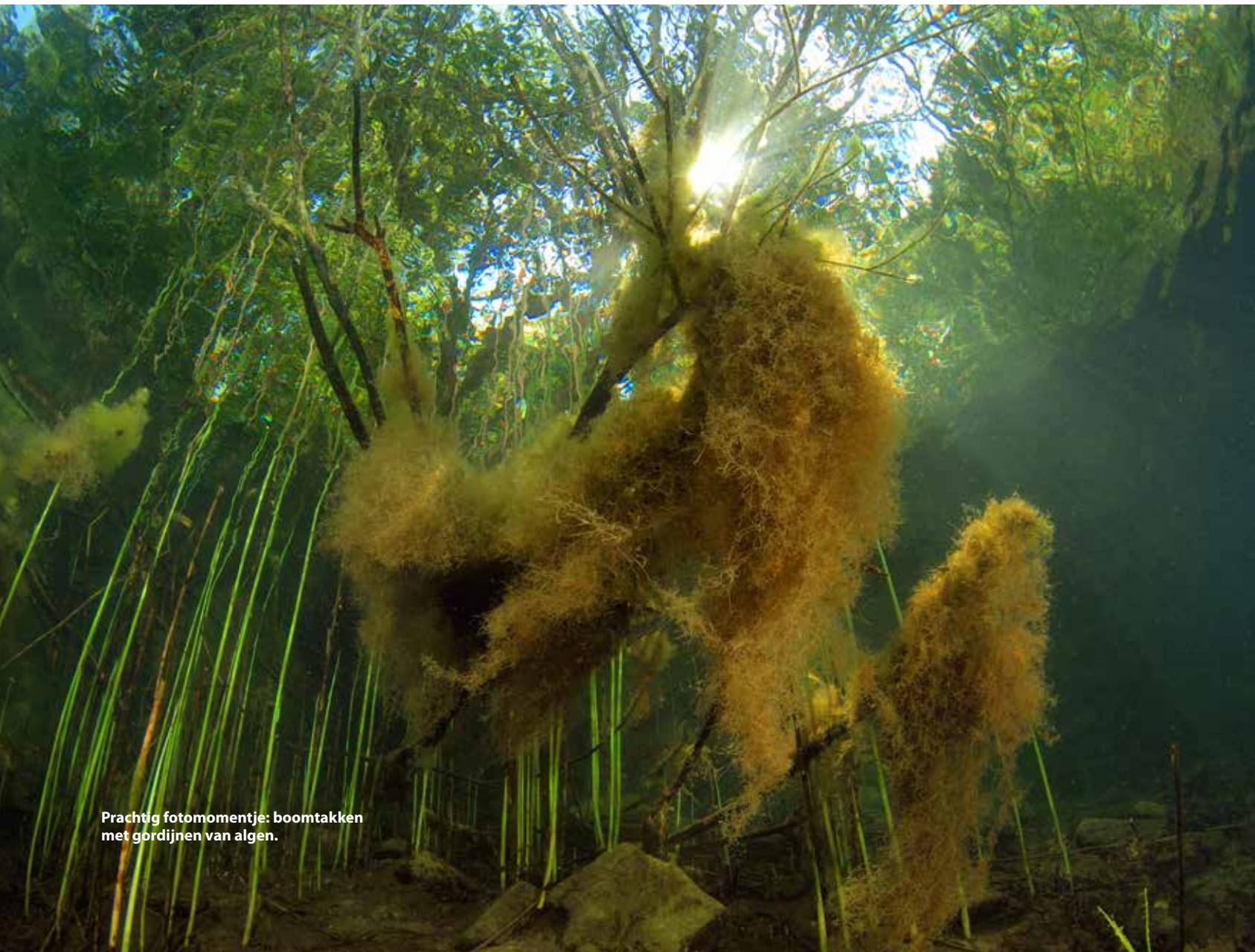
Prachtig fotomomentje: boomtakken met gordijnen van algen.