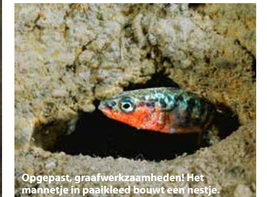
Opgepast, graafwerkzaamheden! Het mannetje in paaikleed bouwt een nestje.

we onder, terug naar de stekelbaarsjes. Direct bij de instapplaats is een mannetje een nestje aan het bouwen in de kleiwand. Hij komt met zijn bekje vol graafvuil uit het nestje en spuugt het uit. Mijn camera klikt erop los. Na enkele herhalingen van zijn graafwerkzaamheden, schiet ik spontaan in de lach. Hij is zo druk bezig dat ik voor hem even niet besta. 'Eerst werken en daarna ga ik weleens kijken wat die glazen bol voor mijn nestje moet'. Geweldig! Ik zoek verder tussen het riet en zie een piepklein snoekje. Dit formaat heb ik nog niet eerder gezien, zo klein. En omdat deze ook nog eens te ver in het riet schuilt is het een onmogelijk fotomodel op dit moment. Opslaan in het brein want dat is eigenlijk het allerleukste van de duiksport, genieten van dit soort onderwatermomenten!