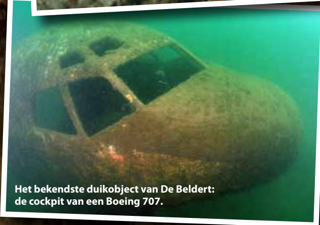
Het bekendste duikobject van De Beldert: de cockpit van een Boeing 707.