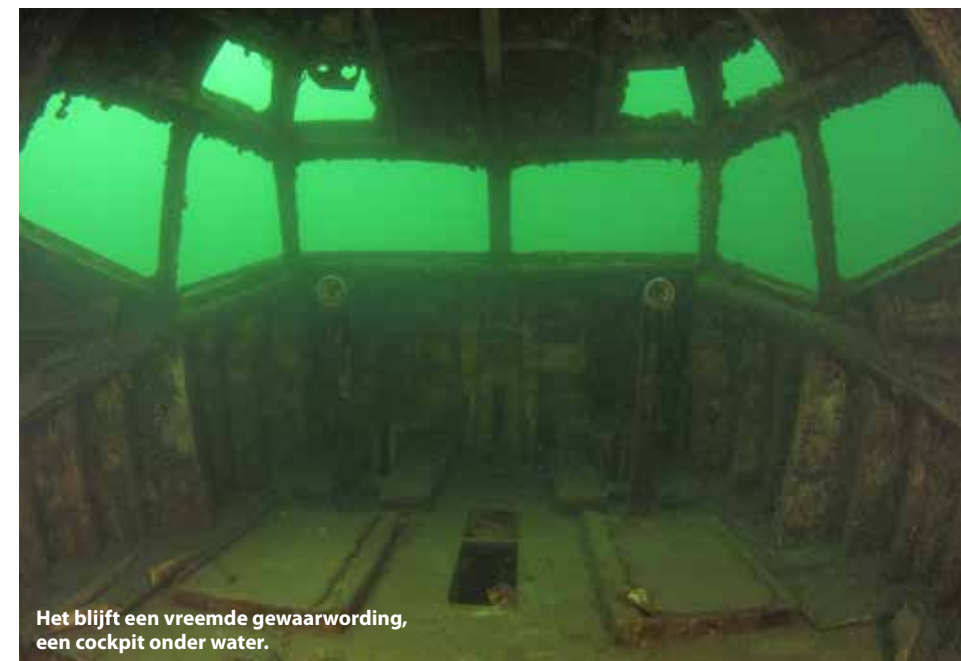
Het blijft een vreemde gewaarwording, een cockpit onder water.

we onder, terug naar de stekelbaarsjes. Direct bij de instapplaats is een mannetje een nestje aan het bouwen in de kleiwand. Hij komt met zijn bekje vol graafvuil uit het nestje en spuugt het uit. Mijn camera klikt erop los. Na enkele herhalingen van zijn graafwerkzaamheden, schiet ik spontaan in de lach. Hij is zo druk bezig dat ik voor hem even niet besta. 'Eerst werken en daarna ga ik weleens kijken wat die glazen bol voor mijn nestje moet'. Geweldig! Ik zoek verder tussen het riet en zie een piepklein snoekje. Dit formaat heb ik nog niet eerder gezien, zo klein. En omdat deze ook nog eens te ver in het riet schuilt is het een onmogelijk fotomodel op dit moment. Opslaan in het brein want dat is eigenlijk het allerleukste van de duiksport, genieten van dit soort onderwatermomenten!