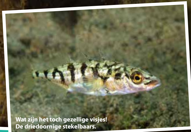
Wat zijn het toch gezellige visjes! De driedoornige stekelbaars.