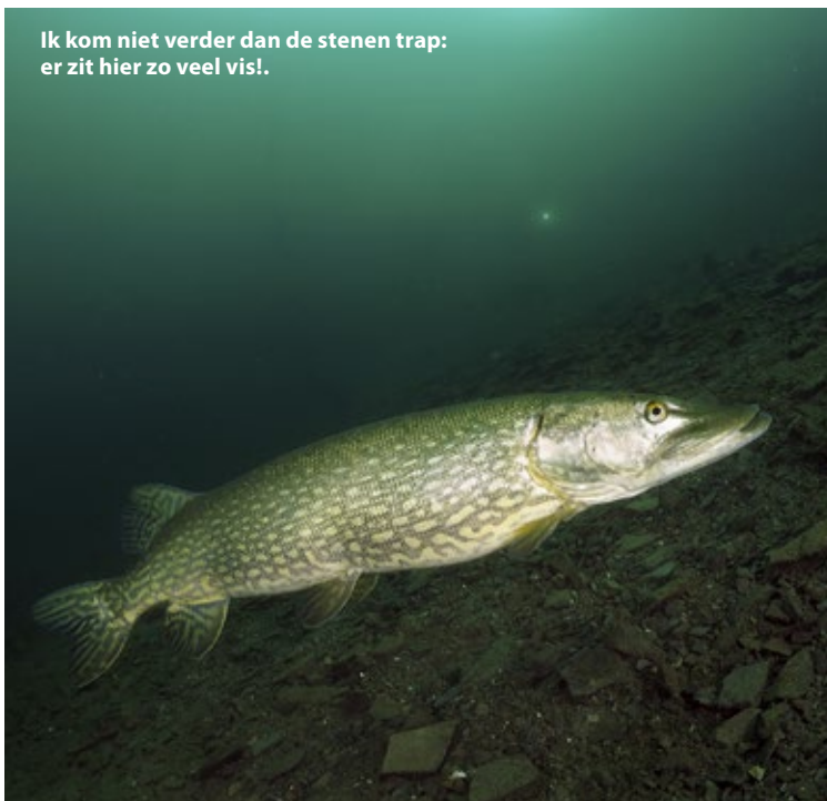
Ik kom niet verder dan de stenen trap: er zit hier zo veel vis!.

Adres: C.L.A.S. Chera de La Gombe, 4130 Esneux, België. www.clas.be