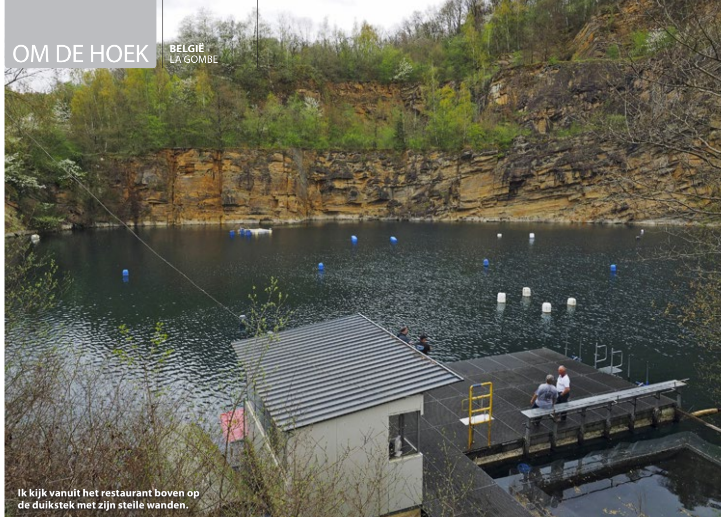
Ik kijk vanuit het restaurant boven op de duikstek met zijn steile wanden.

Onze duikvereniging Aqua Delfia organiseert een duikdagje naar La Gombe. Ik ben er al twee keer geweest, maar mijn aanmelding wordt per ommegaande ingeleverd. Deze duikstek heeft iets magisch. In de volgelopen steengroeve is volop vis uitgezet en er zijn oefenplatforms en duikobjecten zoals een vliegtuig. Dat veel duikers buiten de vereniging uit België, Frankrijk, Duitsland en Nederland hier ook weleens een duikje willen nemen, verbaast mij niet. Deze zonnige dag in april is qua weer wel erg goed. Het zonnetje laat zich regelmatig zien en tussen de twee duiken door is het altijd heerlijk om even op te warmen aan de buitentafels op het terrein. Om 10.00 uur gaat het toegangshek open. Ik kijk vanuit het restaurant boven op de duikstek met zijn steile wanden, wetende dat onder water de steuren zwemmen. Ik kan niet wachten, dit wordt geweldig! We kleden ons om op het parkeerterrein en lopen naar de toegang van de plas. Het te water gaan vanaf het platform is eenvoudig via een commandosprong of via een van de