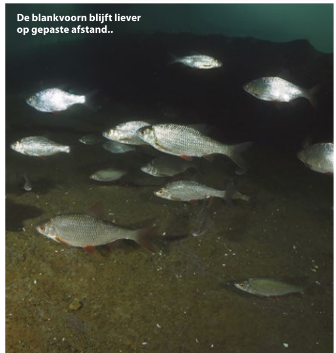
De blankvoorn blijft liever op gepaste afstand..