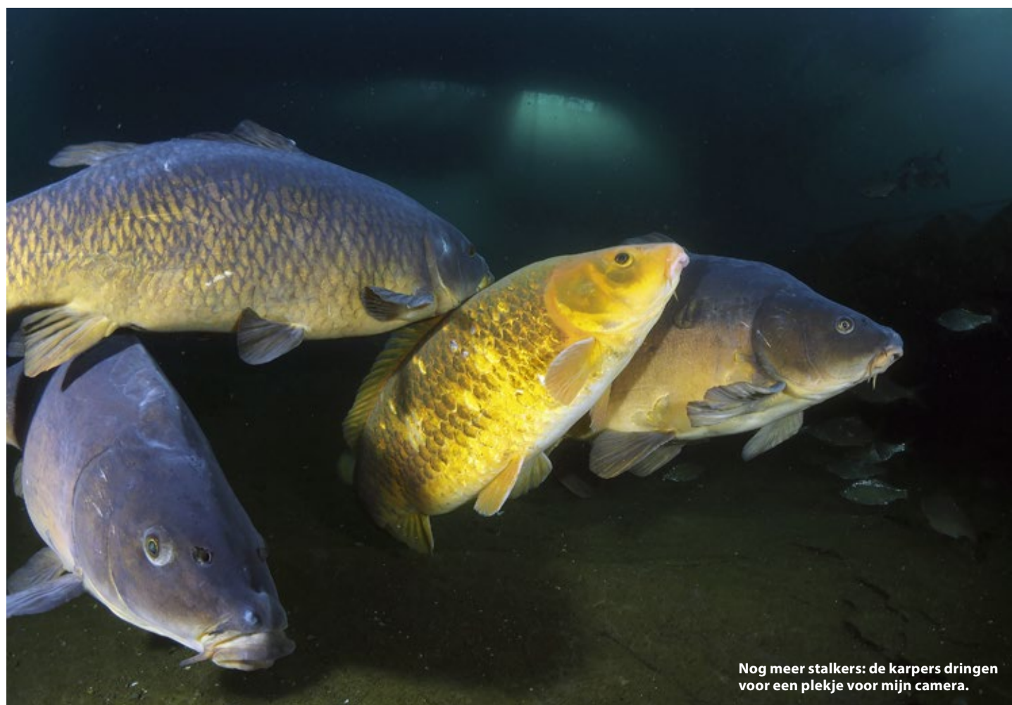
Nog meer stalkers: de karpers dringen voor een plekje voor mijn camera.