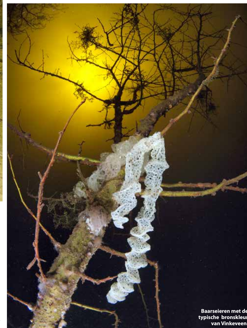
Baarseieren met de typische bronskleur van Vinkeveen.