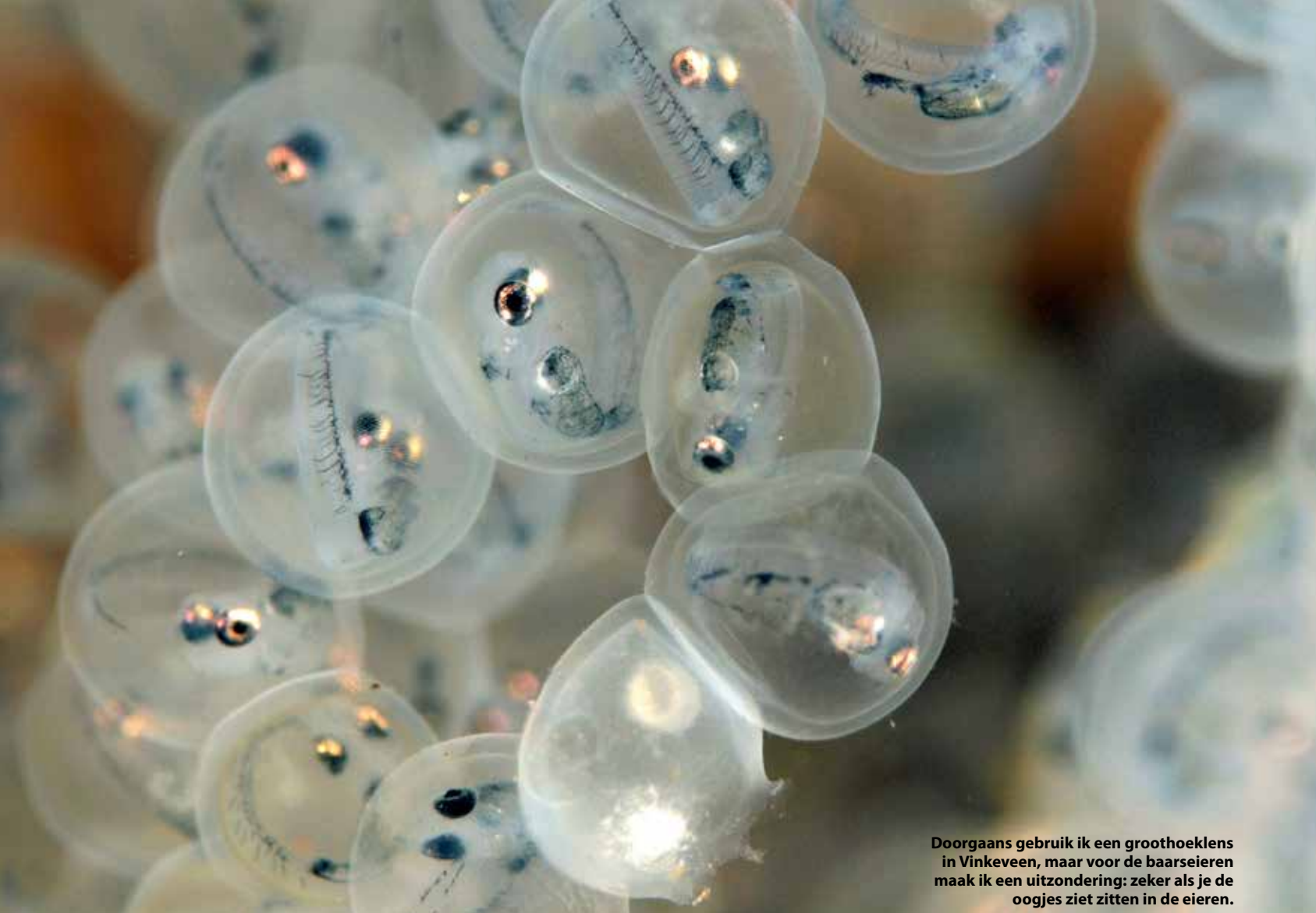
Doorgaans gebruik ik een groothoeklens in Vinkeveen, maar voor de baarseieren maak ik een uitzondering: zeker als je de oogjes ziet zitten in de eieren.