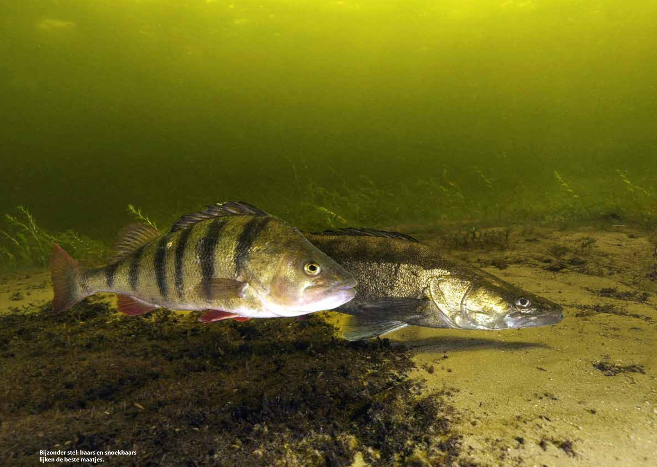
Bijzonder stel: baars en snoekbaars lijken de beste maatjes.

Voor mij is duiklocatie Zandeiland 4 een uitstekende plek om vis te fotograferen. Veel baarzen, snoekbaarzen en snoeken kom je tot twaalf meter diepte tegen. En hoe druk het soms is, er is altijd wel een plekje waar je wat rustiger of met minder opwervend stof je kunt afzonderen. Het kenmerkende van de waterplas is de bronskleur welke ontstaat door de veenbodem. Bij helder water en wat zonlicht geeft dit de typische Vinkeveen-sfeer. Je kunt ook bijzondere vissen tegenkomen zoals de kwabaal ( Lota lota ), maar die zie je lang niet altijd. Helaas is hij opgenomen op de Rode