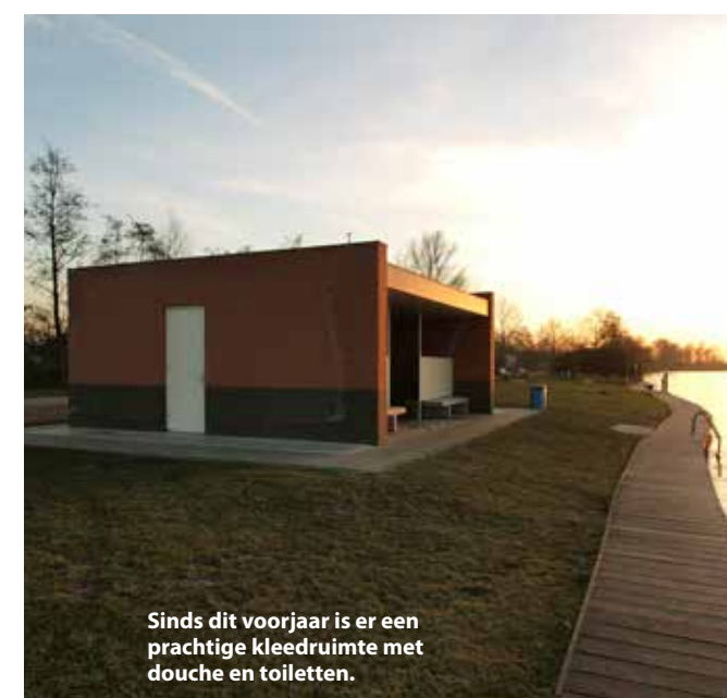
Sinds dit voorjaar is er een prachtige kleedruimte met douche en toiletten.