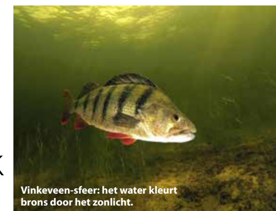
Vinkeveen-sfeer: het water kleurt brons door het zonlicht.

Voor groothoekopnames is het een ideale plas met voor ieder wat wils; grote vissen, wrakken en onderwaterobjecten die er in de loop der jaren door duikers zijn afgezonken. De bekende Bus met een snoek erbij of erin is een typisch voorbeeld hiervan. Misschien wel het meest gefotografeerde onderwerp. Doorgaans gebruik ik een groothoeklens in Vinkeveen, maar voor de baarseieren maak ik een uitzondering. Zeker als je de oogjes ziet zitten in de eieren. Met de macrolens en alle voorzetlensjes die ik ter beschikking heb, convertor x2 en natte voorzetlens +10, fotografeer ik de baarseieren. Je moet hier geduldig voor zijn en wonder boven wonder kan ik dat onder water beter dan boven water. En het resultaat mag er zijn. Weer gave foto's gemaakt bij Zandeiland 4! Het geheim van Vinkeveen? Dat is voor veel duikers eigenlijk al duidelijk. Zandeiland 4 is voor mij een prachtduiklocatie met volop leven en het is er goed vertoeven dankzij de nieuwe voorzieningen. En aan het aantal auto's te zien dat er meestal staat, ben ik echt niet de enige die hier zo over denkt.