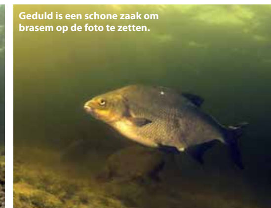
Geduld is een schone zaak om braseem op de foto te zetten.