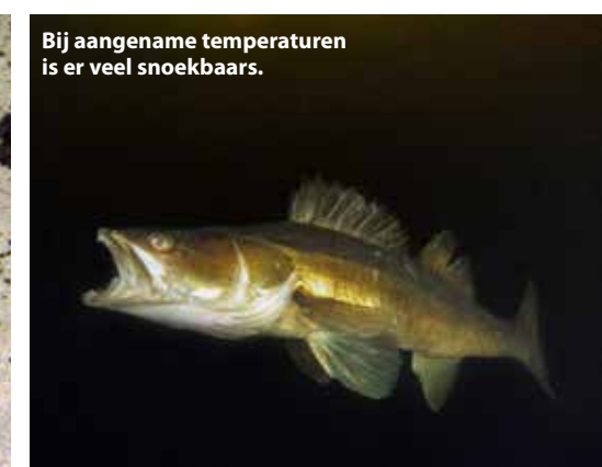
Bij aangename temperaturen is er veel snoekbaars.