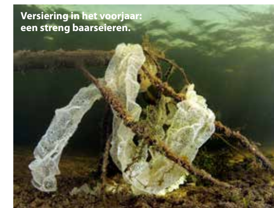
Versiering in het voorjaar: een streng baarseieren.