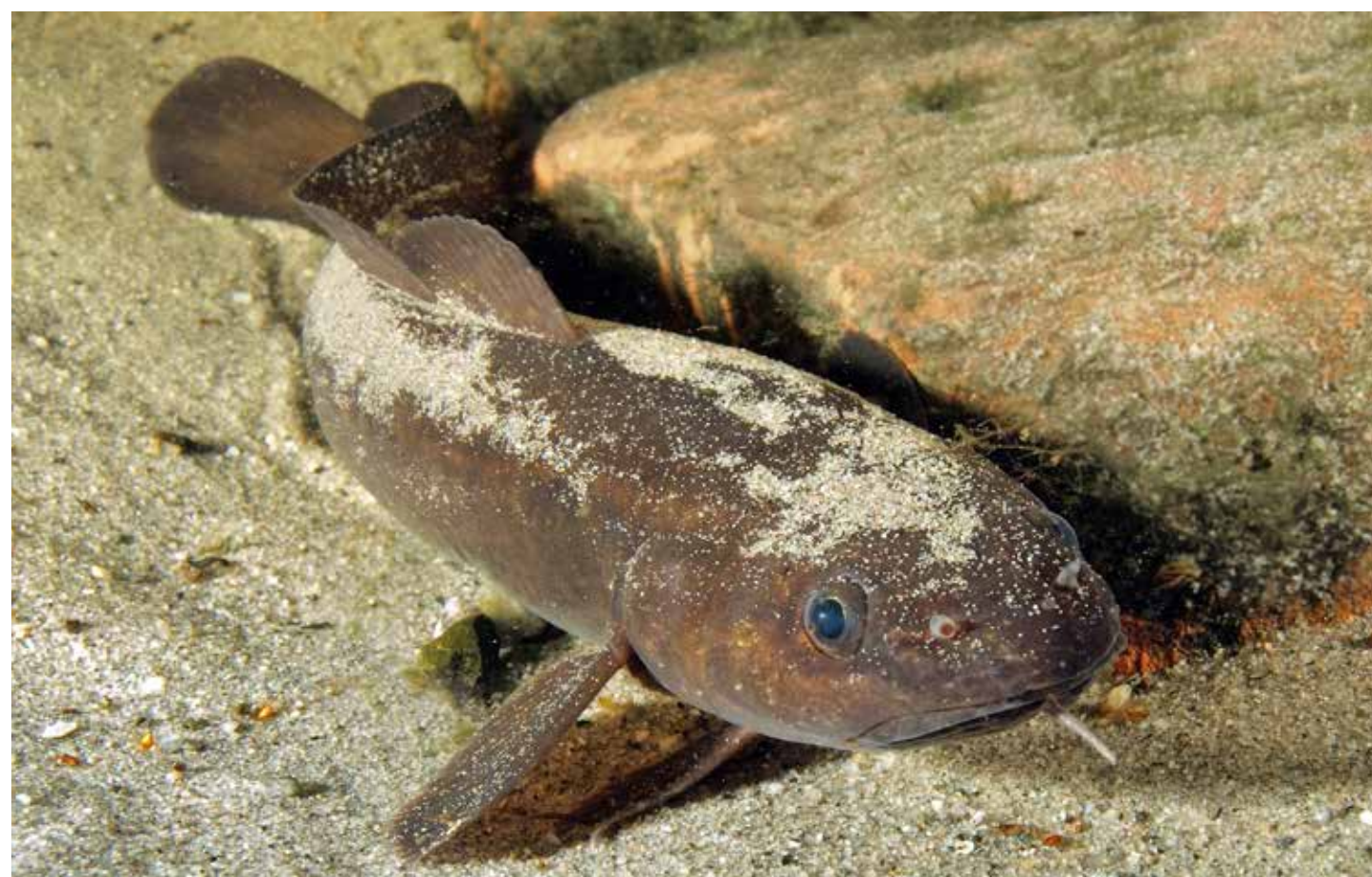
Helaas zijn er niet veel kwabalen meer; ze staan op de Rode Lijst. De kwabaal heeft een kenmerkende kindraad.