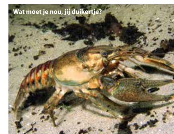
Wat moet je nou, jij duikertje?