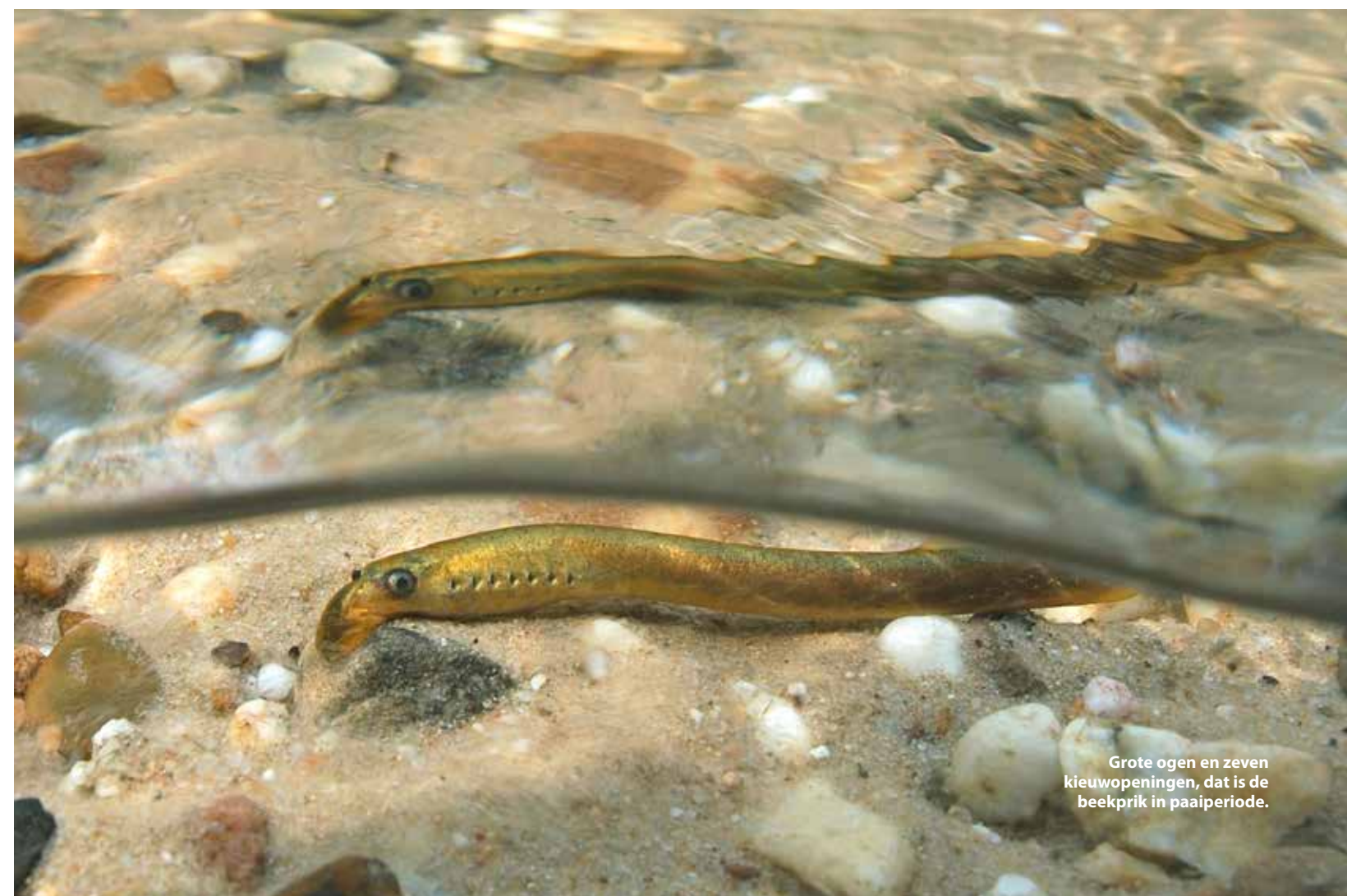
Grote ogen en zeven kieuwopeningen, dat is de beekprik in paaiperiode.