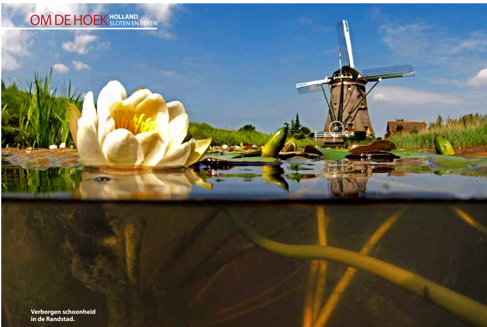
Verborgene schoonheid in de Randstad.