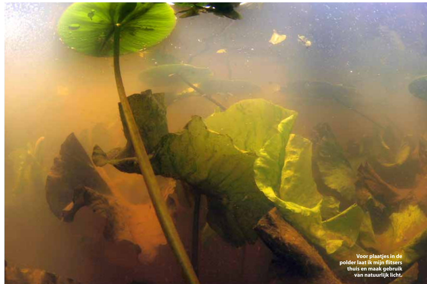
Voor plaatjes in de polder laat ik mijn flitsers thuis en maak gebruik van natuurlijk licht.

Ik heb de smaak flink te pakken en ik ben gaan onderzoeken of een bijzonder onderwerp haalbaar is, namelijk de beekprik. Al geruime tijd intrigeert deze zeldzame vis onder de naam Lampetra planeri mij. Na enig zoekwerk op internet kom ik erachter dat ze voor moeten komen op de Veluwe, waar ze leven in heldere ondiepe beekjes en sprengen. Mijn fiets laat ik nu dus maar even thuis, de auto is wat sneller. De beekprik leeft