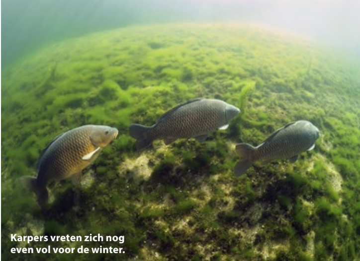
Karpers vreten zich nog even vol voor de winter.