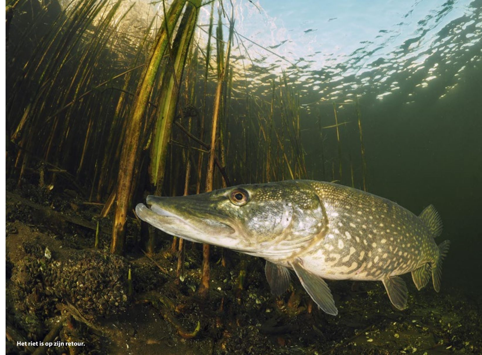
Het riet is op zijn retour.