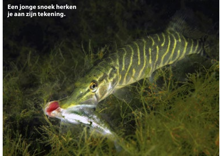
Een jonge snoek herken je aan zijn tekening.