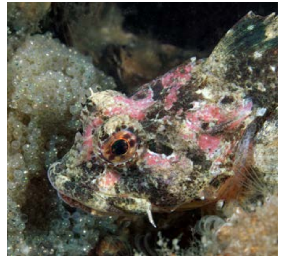
Deze winter volg ik al vijf weken zeedonderpaden bij duikstek Anna Jacobapolder. Dit is een 'groene' met een klomp eitjes.

Volgende week een herkansing. Maar ik heb meer pijlen op de boog. Bij Dreischor parking volg ik nog langer een nest van een 'gewone'. Hij zit op de reefballs. Maar daar ga ik vandaag niet meer naartoe, dat komt de komende dagen wel. Twee dagen later lijkt het weer iets gunstiger en we gaan naar Dreischor. Ik heb een 60mm macro-objectief met extra voorzetlens gemonteerd en de flitsers alvast hierop afgesteld. Vanwege het koude water met een temperatuur van twee graden, wil ik uiteraard zo min mogelijk handelingen doen. Nog een beetje bijstellen tijdens wat testfoto's maken zodra ik onder water ben en op naar het nestje. De timing blijkt perfect want er komen regelmatig eitjes uit van de gewone zeedonderpad, wat geweldig om dit zo te zien! En nu is het werken geblazen, ik moet mij focussen op één eitje waarvan ik denk dat deze snel uitkomt. Door de zoeker heb ik maar een beperkt zicht, ik zie alleen dat specifieke eitje. Wanneer ik even de aandacht richt op de hele eiklomp, zie ik natuurlijk weer een 'beter' eitje en beslis die dan maar