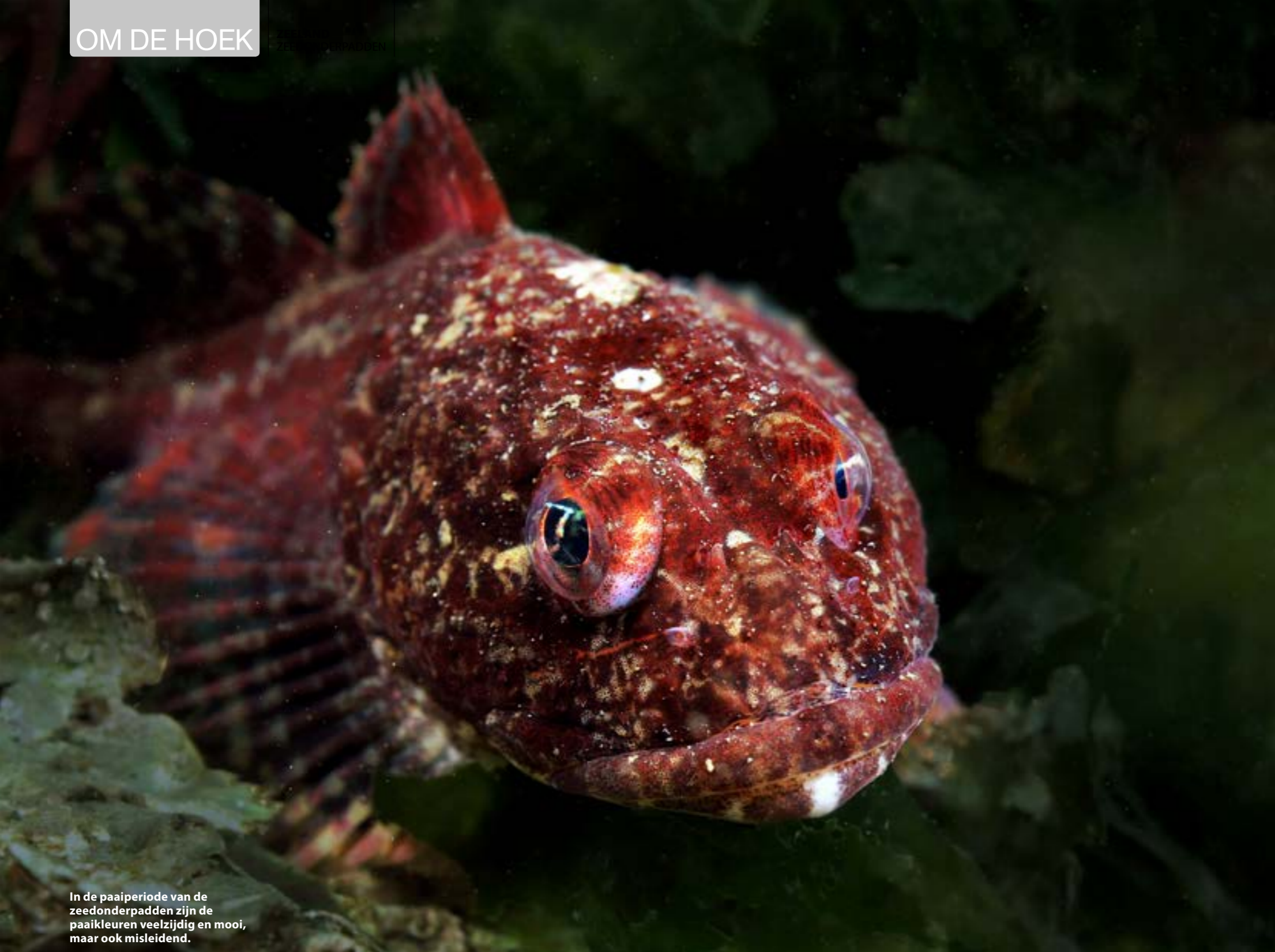
In de paaiperiode van de zeedonderpadden zijn de paaikleuren veelzijdig en mooi, maar ook misleidend.

Zeedonderpad, we hebben een gewone en we hebben een groene in het zoute water van Nederland. Het grote verschil zit 'm in een huidflapje aan weerszijden van de bek. Jawel, zo simpel is het. Tijdens de duik zal de focus dus moeten liggen op dat huidflapje om het onderscheid te maken. Maar dat is niet altijd eenvoudig. Ze zwemmen weg voordat je het weet. Of het bekje ligt zo,