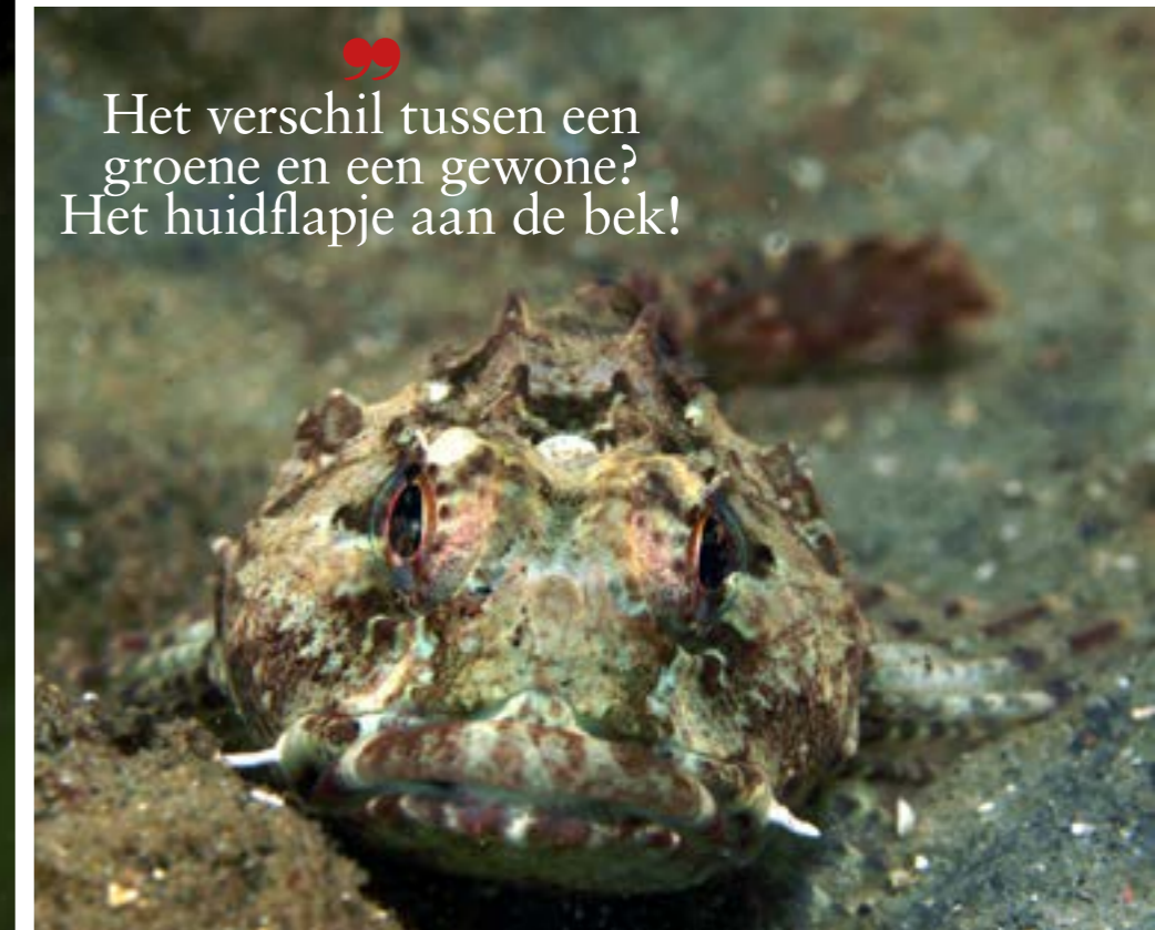
Het verschil tussen een groene en een gewone? Het huidflapje aan de bek!

weer afzien, wat een kou en met die gure wind erbij vraag ik me toch steeds vaker af hoelang ik mij hiervoor telkens weer kan opladen om te gaan. Maar eenmaal onder water, ook niet echt warm, heb ik afleiding en ook het verlangen om de eitjes uit te zien komen maakt het makkelijker. Ik neem wat foto's, alleen het uitkomen van de eitjes gaat op dit nest de komende dagen nog niet gebeuren.