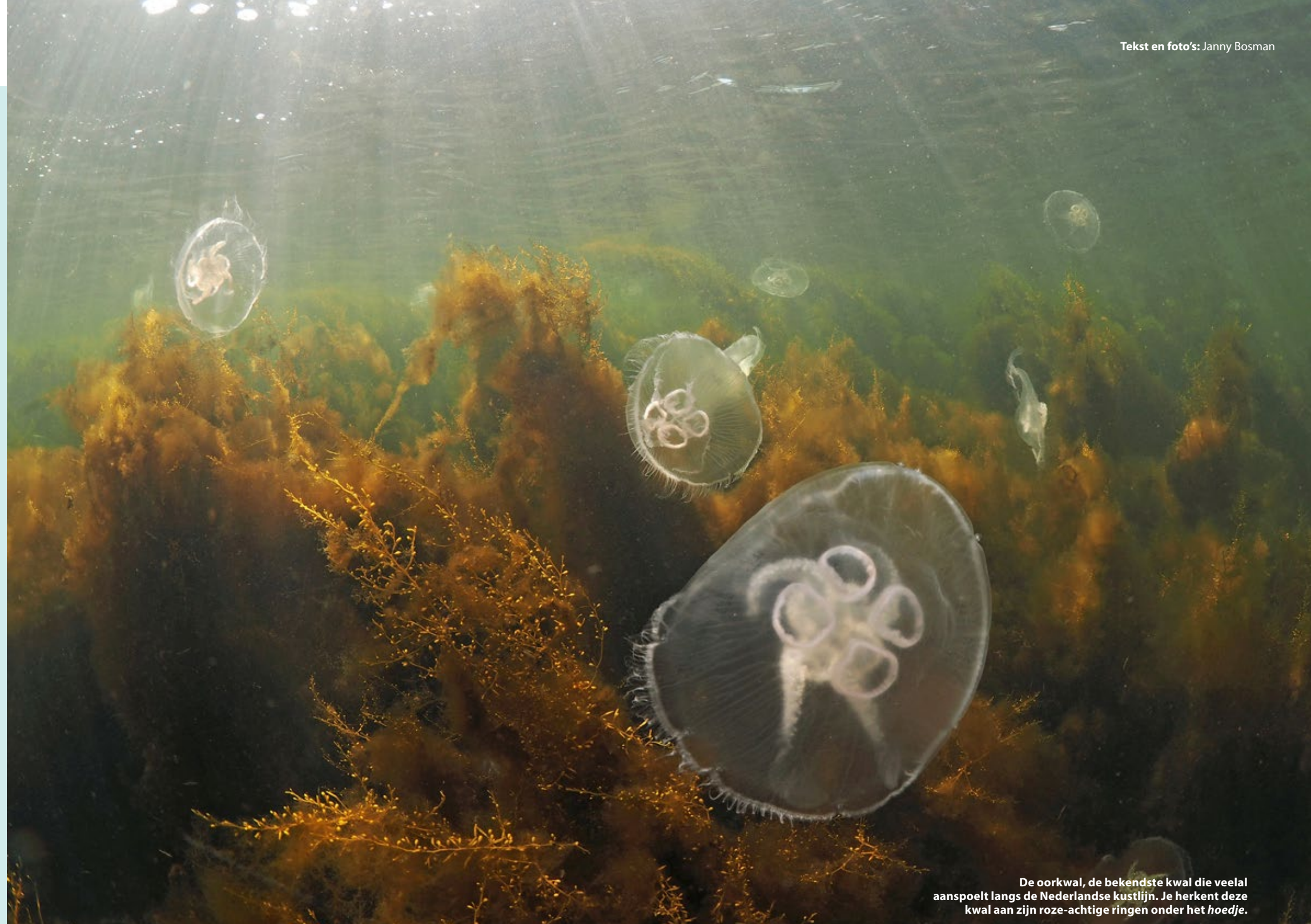
De oorkwal, de bekendste kwal die veelal aanspoelt langs de Nederlandse kustlijn. Je herkent deze kwal aan zijn roze-achtige ringen onder het hoedje.

van kwalen moeten hebben, is omdat de netelcellen in de tentakels steken in onze huid. Alle kwalen steken, maar met name voor de kompaskwal en de blauwe haarkwal is het oppassen geblazen, deze netelcellen kunnen diep in onze huid doordringen. Kwalen voeden zich grotendeels met plankton, maar ook met krabben- of kreeftenlarven.