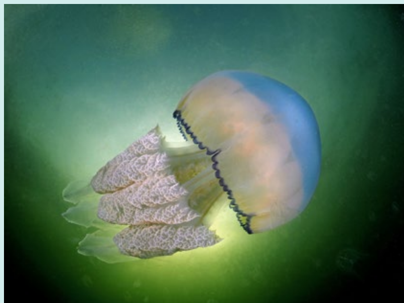
De zeepaddenstoel wordt ook wel bloemkoolkwal genoemd. In tegenstelling tot de andere soorten is het een bolle kwal, met een blauwe kleur.

Niet echt een aantrekkelijk onderwerp, kwalen. Veel mensen moeten er niets van hebben. Zwemmers al helemaal niet. Voor mij is het geen probleem, ik ben goed beschermd in mijn droogpak. Ik zal het nog anders vertellen, ik ga in het najaar speciaal naar hen op zoek. En dan met name naar de zeepaddenstoel, dat is veruit mijn favoriet.