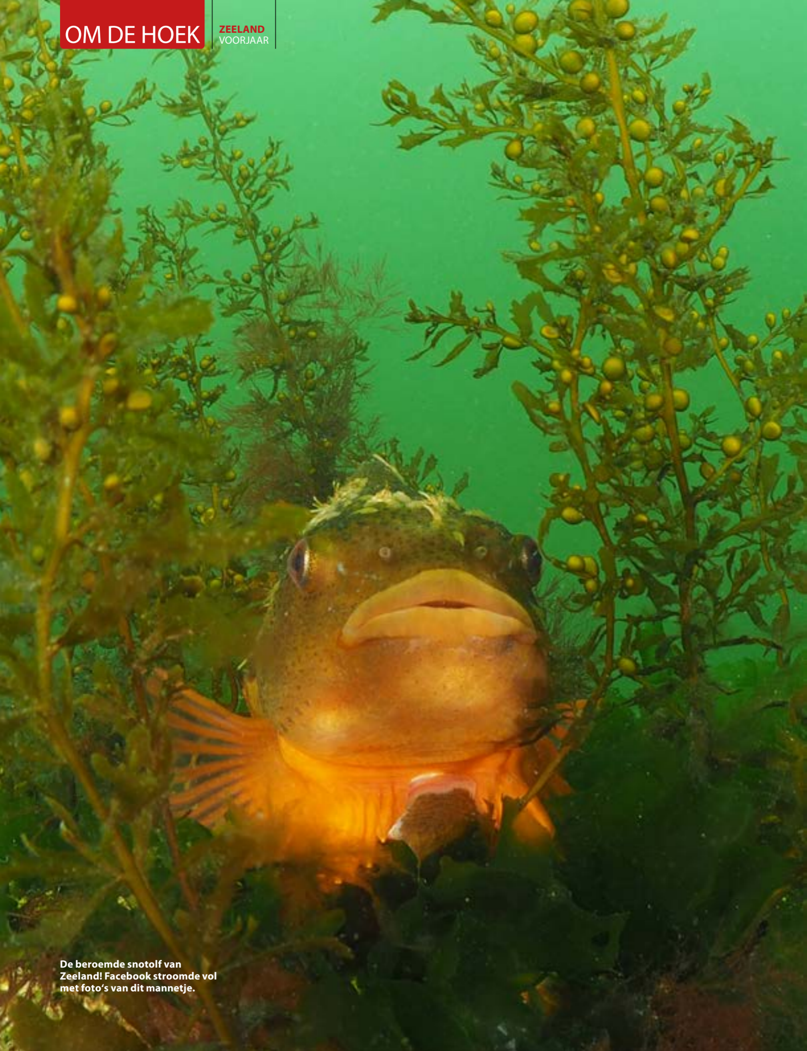
De beroemde snotlof van Zeeland! Facebook stroomde vol met foto's van dit mannetje.