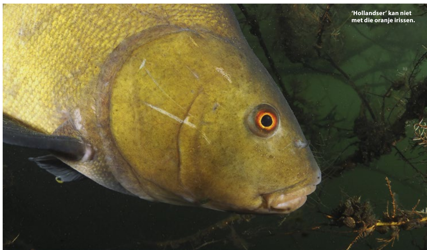
'Hollandser' kan niet met die oranje irissen.