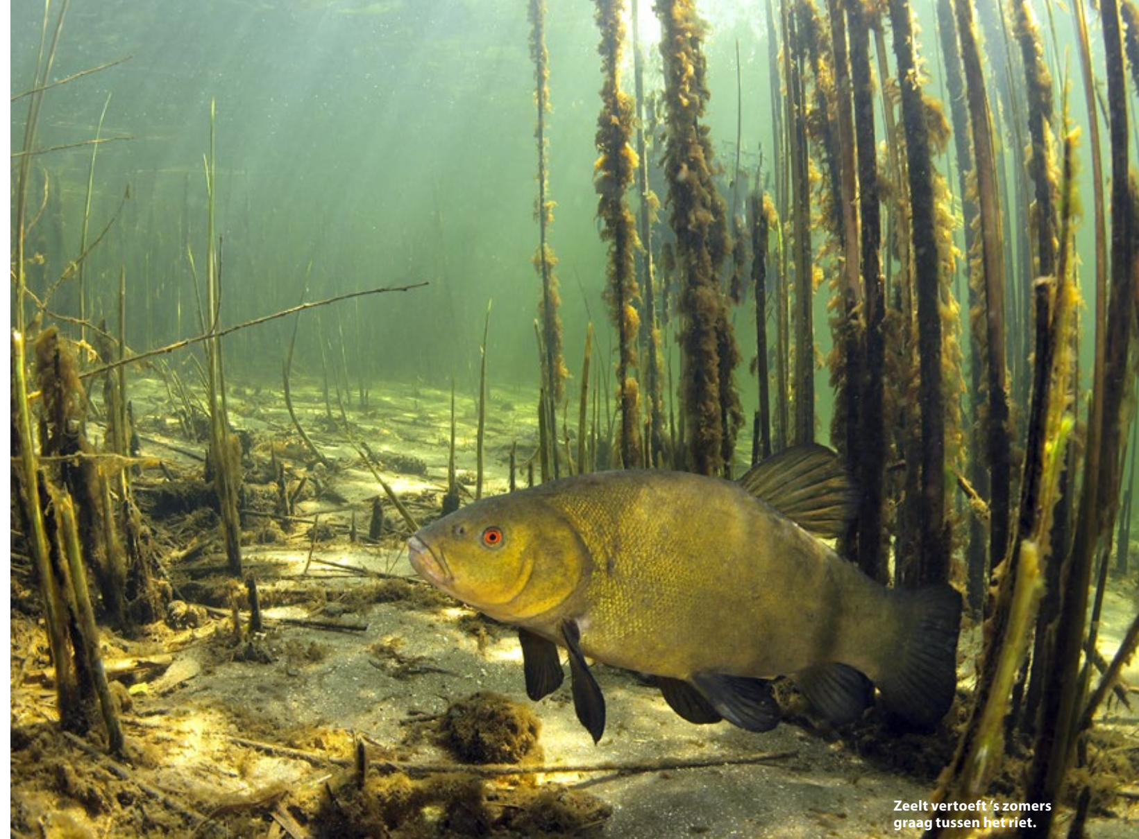
Zeelt vertoeft 's zomers graag tussen het riet.

Leefgebied: In stilstaand zoet water met voldoende waterplanten. Van sloot tot zandafgraving. Waterplanten zijn een belangrijke factor in het leefgebied van zeelt. Tijdens hun winterslaap rusten ze vaak in de sliblaag van de bodem. Zeelt heeft iets bijzonders onder de vissen, zij kunnen wél goed tegen een zuurstofarme periode. Wanneer de waterplanten in het najaar afsterven, daalt hierdoor ook het zuurstofgehalte in het zoete water. Maar zeelt kan hier blijkbaar goed mee omgaan.