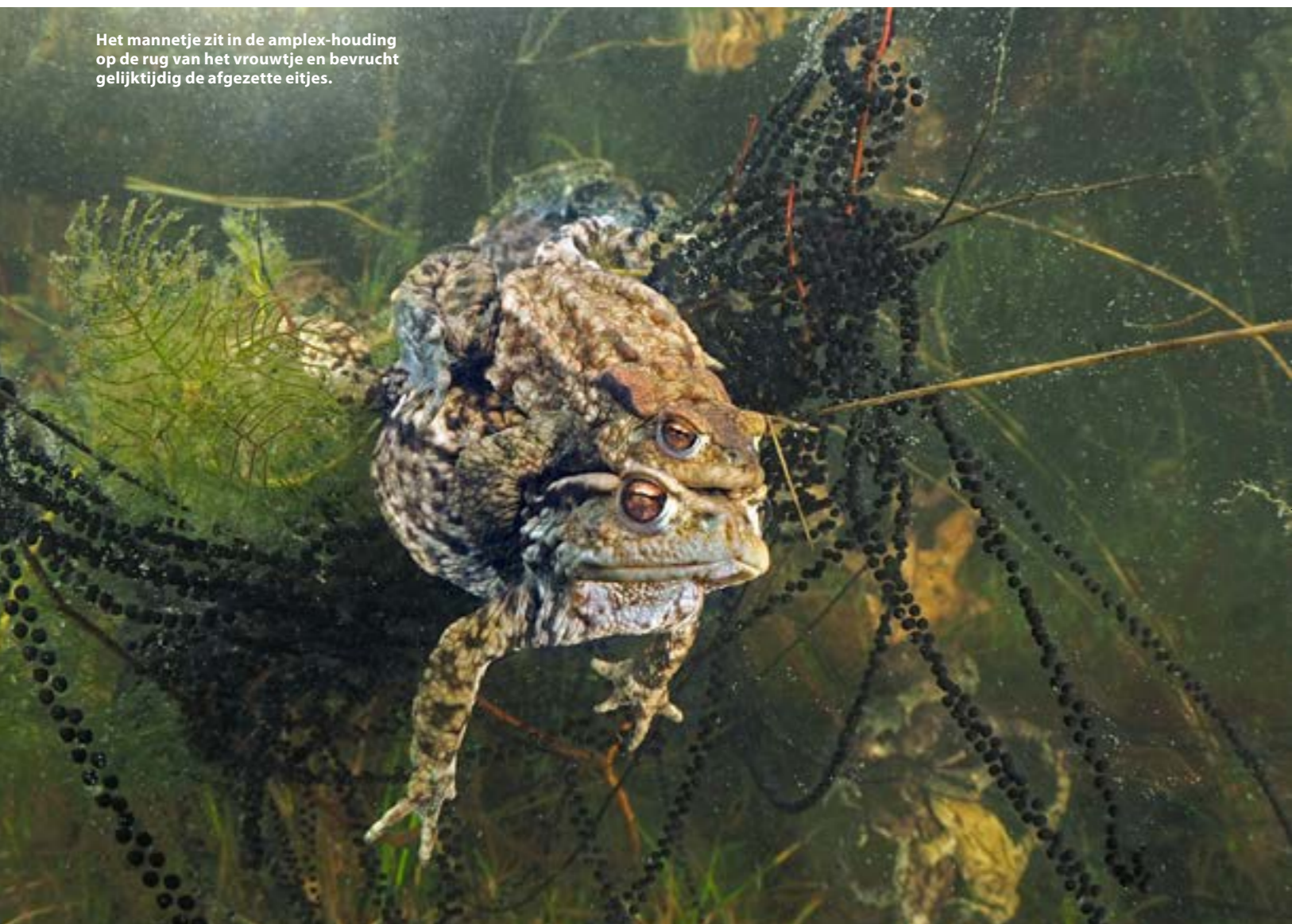
Het mannetje zit in de amplex-houding op de rug van het vrouwtje en bevrucht gelijktijdig de afgezette eitjes.

een plas zijn waar ik van onderaf de oever met de padden kan fotograferen zonder zweefvuil te maken. Helaas zijn die plassen veruit in de minderheid en is het dus vaker baggeren. Al met al een korte maar plezierige traditie, laat mij maar lekker aanmodderen!