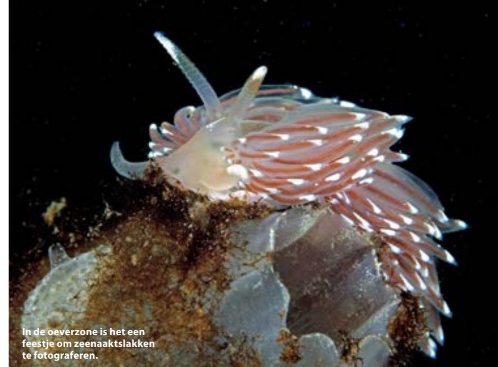
In de oeverzone is het een feestje om zeenaaktslakken te fotograferen.

Het is geweldig deze dagen, al zou je dat niet zeggen van de watertemperatuur in de Oosterschelde... Zes graden! We duiken bij de Zeelandbrug en ik heb besloten macrofotografie te gaan doen. Zeenaaktslakken komen in overvloed voorbij op social media, dus het moet gek lopen als wij daar ook niet van kunnen genieten. De tubularia staat prachtig te wuiven in de stroming en ik vind een ringsprietslak boven op de steel van een kokerworm. Na de duik is er zelfs gelegenheid om lekker wat bij te kleuren in het zonnetje, heerlijk dit voorjaar. We duiken deze week nog bij Dreischor in de Grevelingen en ook hier is het een feestje om de zeenaaktslakken en de oeverzone te fotograferen. Met al dat mooie weer is er tussendoor voldoende gelegenheid om de flamingo's in het Grevelingemeer te bekijken. Als dat geen goed gevoel geeft, weet ik het ook niet meer.