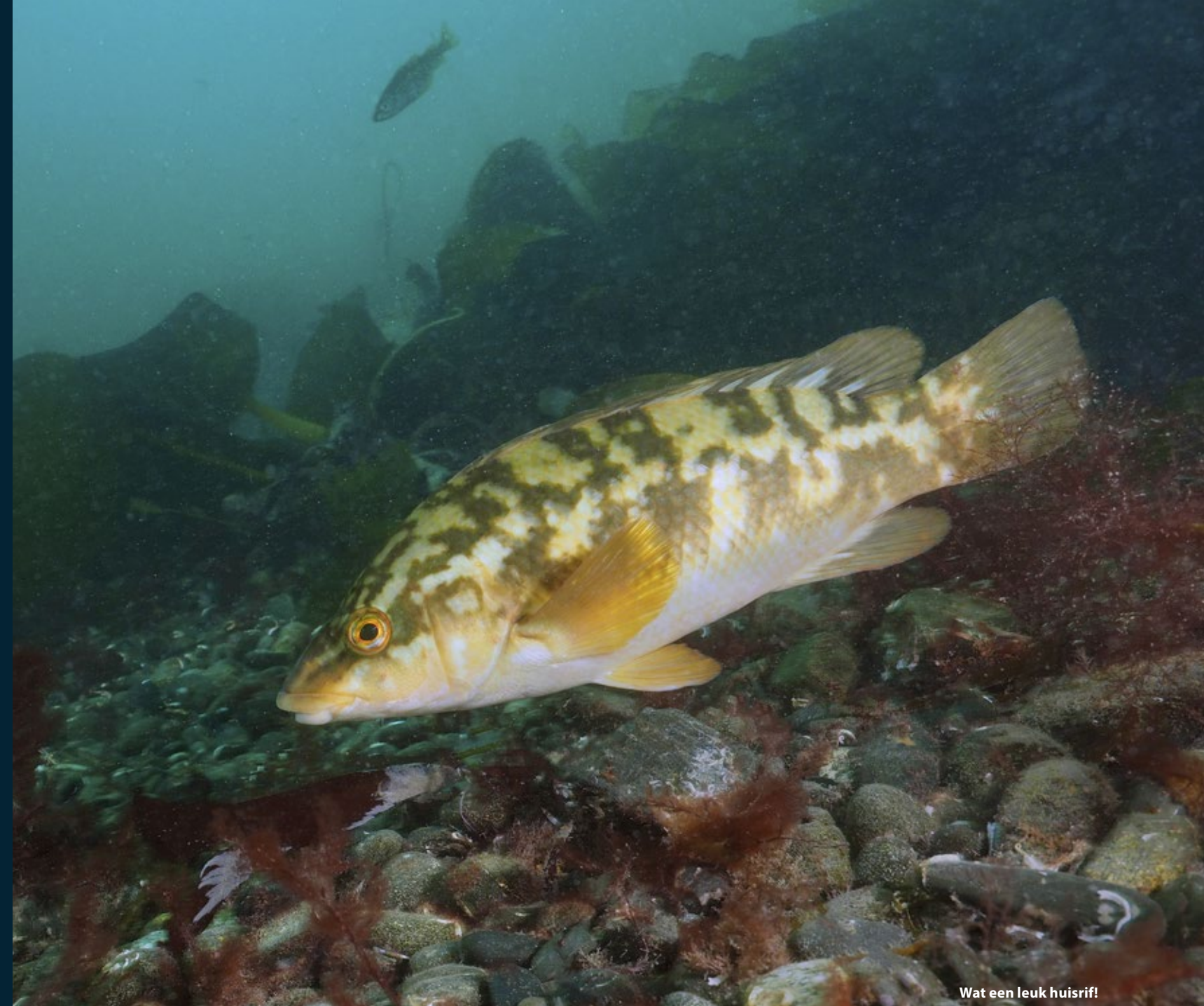
Wat een leuk huisrif!

Het voordeel van een autovakantie is voor mij dat ik de duikspullen en de cameraset gewoon kan inladen. Niets demonteren en op bestemming weer monteren. Geen aandacht voor overgewicht of batterijen in handbagage. Alsof ik naar Zeeland vertrek voor een duikje. We besluiten de oversteek te maken met de autotrein via de Eurotunnel tussen Calais en Folkstone. Het treintraject duurt slechts 35 minuten. Naarmate we dichterbij onze bestemming in Cornwall komen, worden de wegen steeds smaller. Maar we rijden door een prachtig landschap met ruige kusten. De volgende dag melden we ons bij de duikschool Porthkerris, gelegen aan de kust, nabij een typisch Engels dorpje Saint Keverne. Voor de eerste dagen besluiten we kantduiken te maken