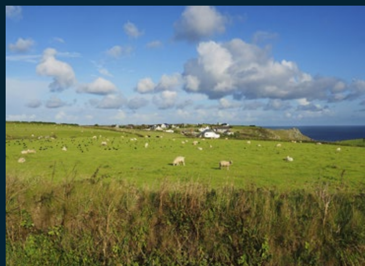
Het gezellige havenplaatsje Coverack voor na de duiken. Koekoek, daar is het nieuwsgierige mannetje dan! Juweelanemonen in allerlei kleuren op een diepte van 23 meter. Lizard Point, het zuidelijkste puntje van het vasteland.