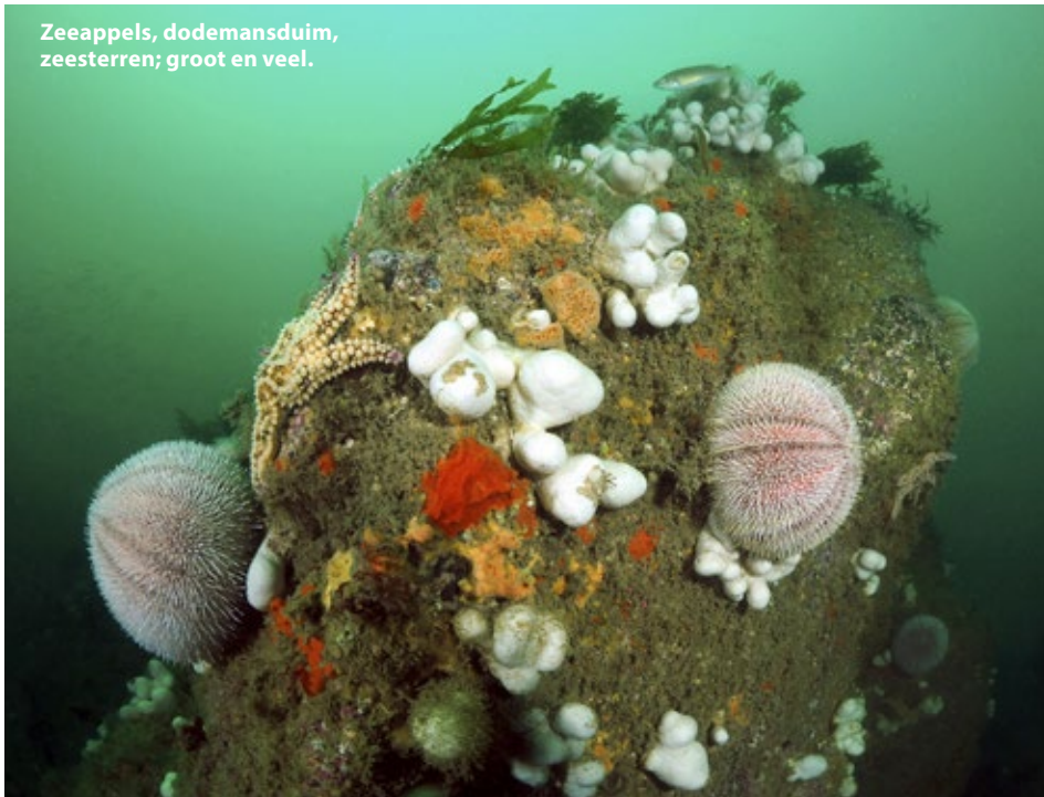
Zeeappels, dodemansduim, zeesterren; groot en veel.