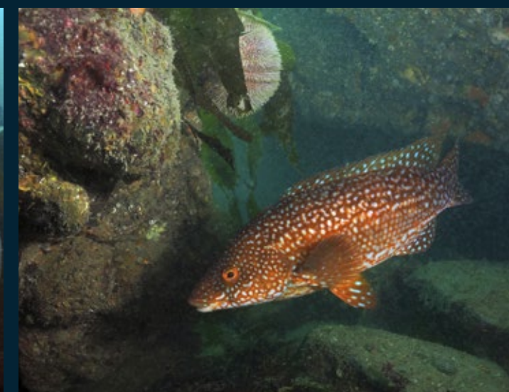
Nog een kleurrijke inwoner tussen de grillige rotsen.