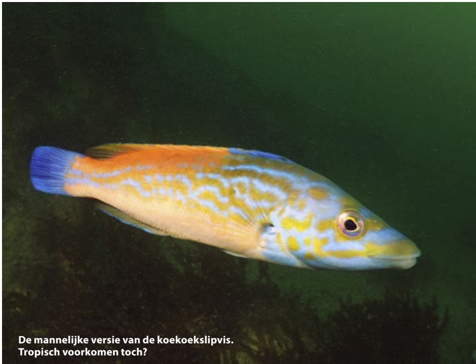
De mannelijke versie van de koekoekslipvis. Tropisch voorkomen toch?