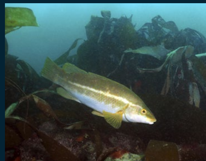
Lipvissen en kelp, we zijn in Cornwall.

Onze interesse voor de lipvissen is gewekt dus kruipen we 's avonds achter de computer. Er zijn meerdere soorten, welke hebben we allemaal gezien? En vooral, welke nog niet? Eentje springt ertussenuit en dat is de lipvis met de bijzondere naam koekoekslipvis, Labrus mixtus . Het volwassen mannetje is prachtig in de kleuren geel, oranje en blauw. Om de kans te vergroten deze vis te zien, boeken we bootduiken naar de Manacles, een onderwaterriffenstelsel iets verder uit de kust en naar grotere dieptes. We dalen af via een uitgegooide afdaallijn naar een