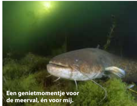
Een genietmomentje voor de meerval, én voor mij.