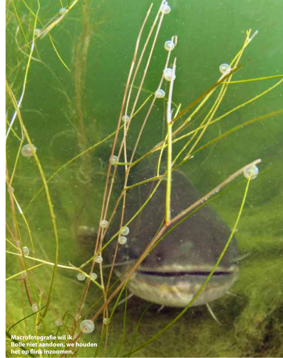
Macrofotografie wil ik Bolle niet aandoen, we houden het op flink inzoomen.